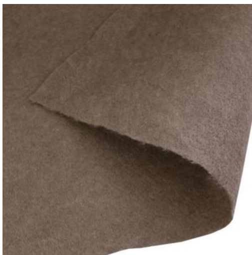
Рис.1. Нетканное геополотно «Текспол»

Тканый аналог встречается реже (на основе полиэфирного волокна - более совершенный вариант) и мало чем от него (по основным характеристикам, специфике применения) отличается, кроме технологии изготовления (переплетение нитей). Основные функции материала - дренаж (фильтрация) + армирование (усиление). В продажу "Дорнит" поступает в рулонах, как правило, длиной от 50 до 150, шириной 1,5-5,3 (м). Основное предназначение (как и любого полимерного и проницаемого для жидкости полотна) - создание разделительного барьера между разнородными средами и материалами.