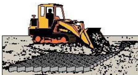
Рисунок 4, Рисунок 5